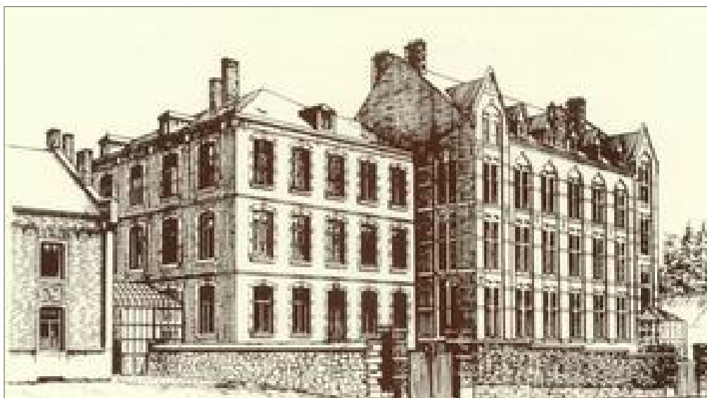
Vue ancienne de l'école des Sœurs de la Sainte Famille à Jemelle